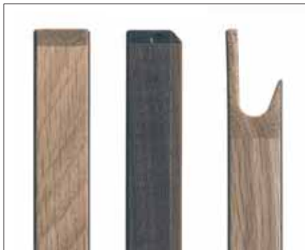
Laminat: rak, fas och greppa

EN SLÄT LUCKA I LAMINAT, MED ANTINGEN RAK EKKANT UTAN UTSVÄVNINGAR ELLER MED EN FASAD KANT SOM FRAMTRÄDER MARKANT MELLAN LUCKORNA. LYFTER ETT ANNARS HELVITT KÖK OCH GER EN EGEN KARAKTÄR BEROENDE PÅ TRASLAGET DU VÄLJER. I KOMBINATION MED SVART GRANIT OCH ROSTFRITT SOM TILL VÄNSTER HAR DU ETT KÖK SOM HÅLLER STILEN I LÅNG TID FRAMÖVER, OAVSETT TRENDER. BÄNKSIVOR JETSTONE. DISKBANKEN IFRÅN STALA OCH VITVAROR FRÅN SIEMENS OCH FJÄRÅSKUPAN.